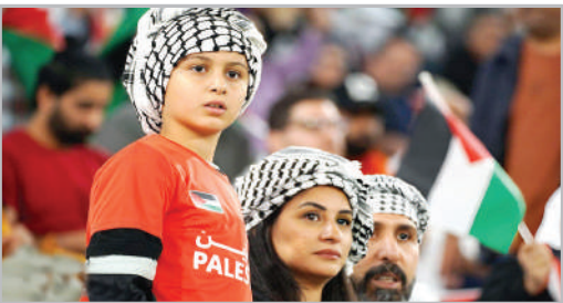
حاشیه دیدار تیم‌های ملی ایران و فلسطین