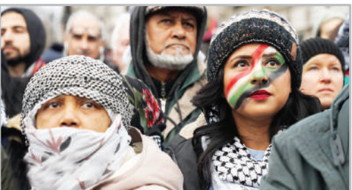
راهپیمایی لندن‌های برای غزه