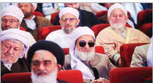
کردهمایی نمایندگان ولی فقیه و ائمه جمعه سراسر کشور