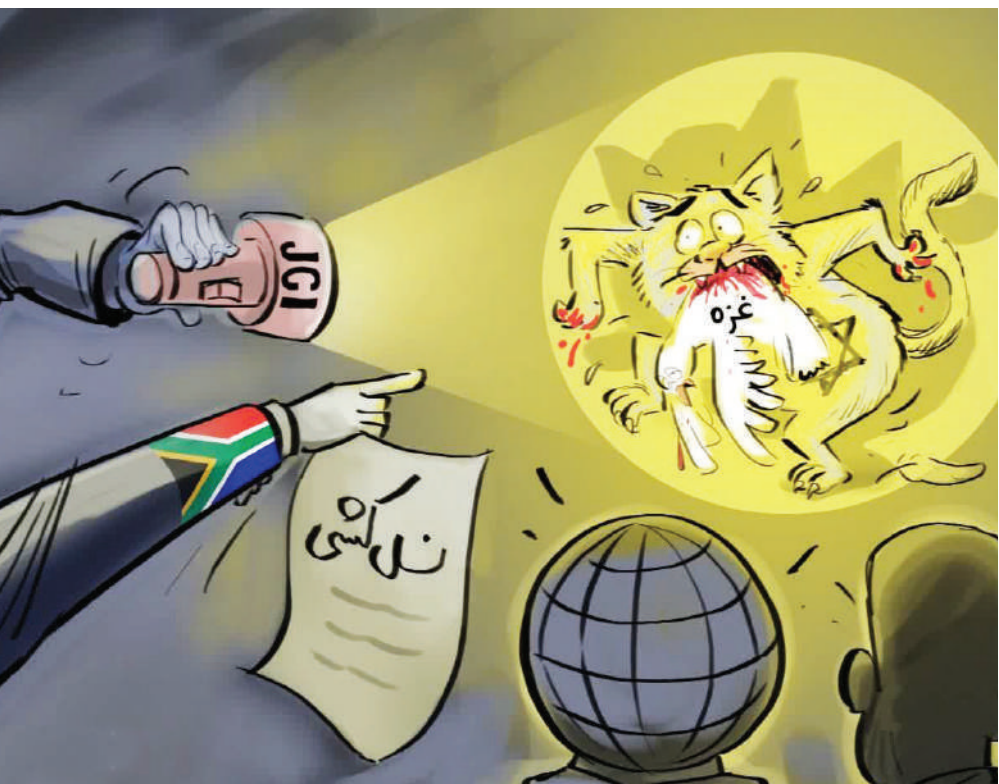
شکواهی علیه نسل‌کشی رژیم صهیونیستی